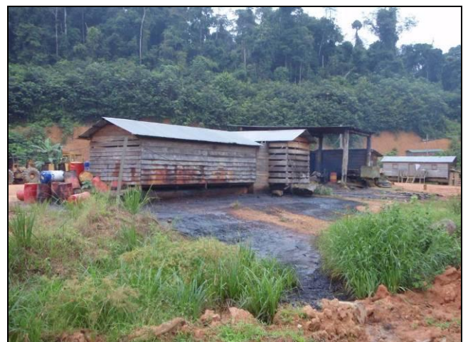
Photo 3: huiles usagées se répandant dans les sols et le cours d'eau en contrebas de la zone de stockage