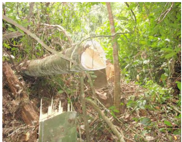
Photo 1 : Arbres coupés en travers de la piste, entravant la progression de l'OI

Après un long détour, la mission est arrivée au layon de base de la CA 2007 et non à la zone d'achèvement, comme demandé au guide. Au retour, la mission a croisé 2 poids lourds évacuant des grumes de la SFIB, attestant ainsi de la poursuite de l'évacuation de bois, contrairement aux affirmations