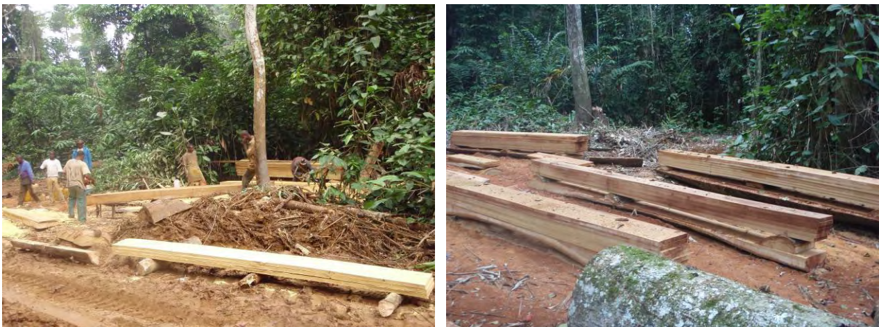
Photo 4: Bois sciés à l'extrémité d'une piste de débardage et ayant été déclarés comme étant destinés aux bureaux de la SFIB à Pointe-Noire

Lors du contrôle de terrain quatre problèmes majeurs ont été décelés : le défaut de marquage des grumes, souches et culées d'une part, l'abandon des bois d'autre part, ensuite la mauvaise tenue des documents de chantier et enfin la coupe de bois en toute illégalité dans une forêt concédée à une entreprise tierce.