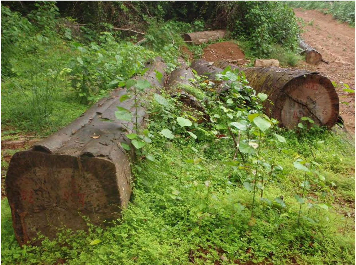
Photo 2: grumes abandonnées sur parc issues de la Coupe Annuelle 2007 de la SFIB