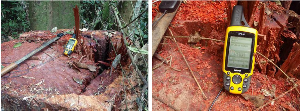
Photo 3: Souche de Padouk non marquée le long d'une piste de débardage située dans l'UFE Nyanga