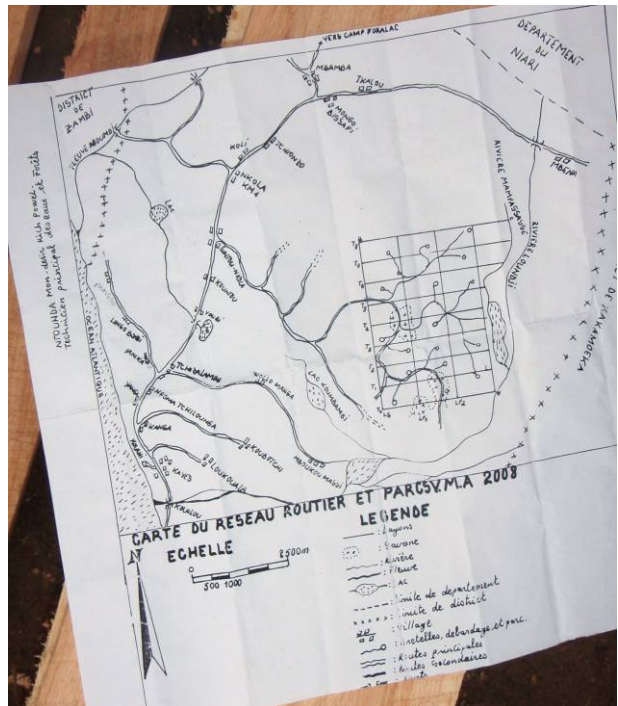
Photo n°2 : Inscription sur un arbre du layon principal 1 (1) et carte de la coupe annuelle 2008 (2)

A l'issue de cette vérification, la mission a conclu que les limites étaient bien ouvertes, et que la société n'avait pas coupé des bois hors du périmètre affecté à son exploitation. Par ailleurs, les agents de la DDEFK ont recommandé à la société d'entretenir les layons.