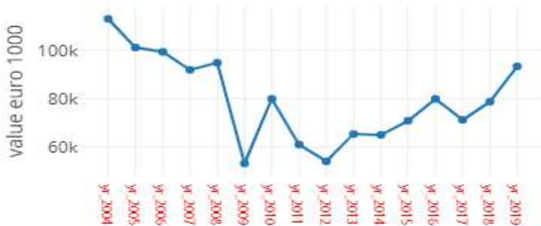
Figure 1. Valeur en milliers EUR des importations européennes de bois congolais, 2004-2019

En volume, on note également une tendance à la hausse, même si les quantités écoulées (250 000 m3 équivalent bois rond) sont loin de rivaliser avec celles de la fin des années 2000.