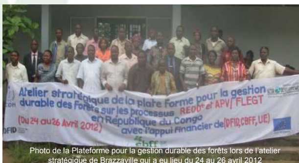
Photo de la Plateforme pour la gestion durable des forêts lors de l'atelier stratégique de Brazzaville qui a eu lieu du 24 au 26 avril 2012

Elle a contribué à la négociation de l'Accord de partenariat volontaire APV-FLEGT Congo. De même pour la REDD dont la version finale du Plan de Préparation du Projet a été validée en fin 2011.