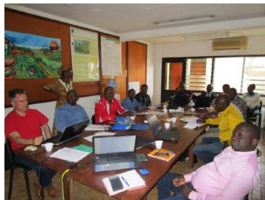
Formation des participants en salle

Pour étayer son programme d'intervention, la Cellule d'Appui Technique s'est appuyée sur les résultats de la première campagne de diagnostics des entreprises forestières, qui s'est déroulée entre avril et juin 2017 auprès de 24 sociétés. (suite p.4)