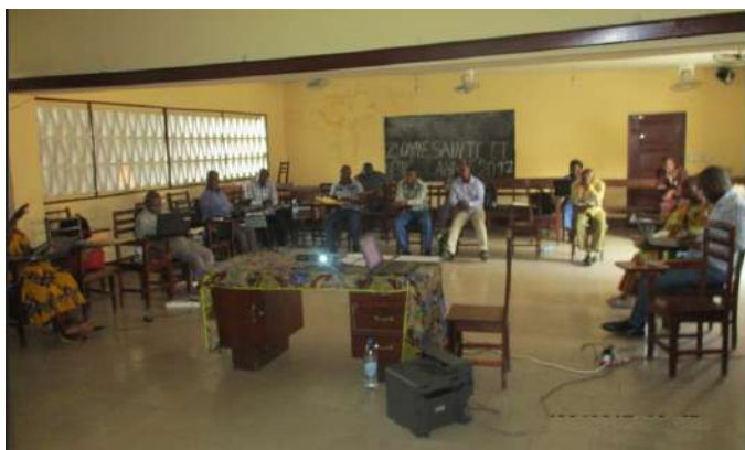
Une vue d'ensemble des participants

La société civile à travers la Plateforme pour la Gestion Durable des Forêts (PGDF) a bénéficié, en 2016, d'une formation du Fonds mondial pour la nature (WWF) afin de s'approprier l'outil d'évaluation rapide permettant de mesurer la qualité de la gouvernance qui affecte la performance du secteur forestier (EEAT).