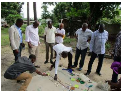
Exercice pratique sur la cartographie participative

Ces diagnostics, réalisés par le Bureau d'études OBBOIS, ont permis d'identifier les indicateurs de la grille de légalité les moins satisfaisants. Ces derniers concernent principalement les principes 3 et 4 de la grille de légalité de l'APV-FLEGT, relatifs au social interne et externe des entreprises, à l'environnement, l'aménagement forestier, l'exploitation forestière, la transformation du bois et la fiscalité.