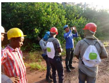
Une équipe de l'OI en mission de terrain

Le Cercle d'Appui à la Gestion Durable des Forêts (CAGDF), dans ses efforts de maintenir les activités d'Observation Indépendante (OI) en République du Congo et renforcement de la société civile à la thématique, vient de bénéficier d'un appui financier de l'UE, au travers un projet sous régional intitulé «Voix des citoyens pour le