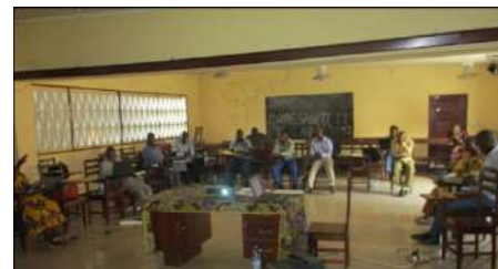
Vue des participants pendant l'atelier national de validation des textes d'application du 9 au 10 juin 2017

Dans la poursuite de ce travail, la PGDF a bénéficié de l'appui de WWF pour réaliser l'analyse juridique de 7 drafts des textes d'applications, qui a abouti en juin 2017 à la production d'un rapport regroupant les commentaires et observations de la société civile sur : 1) les étapes pour l'élaboration d'un plan d'aménagement ; 2) la composition et le fonctionnement de la commission de validation du plan d'aménagement ; 3) la liste des autres produits forestiers, la quantité des pieds d'essence de bois d'œuvre autorisée, les zones dans lesquelles sont attribués le permis spécial/d'exploitation domestique, la durée, ainsi que les modalités de son attribution ; 4) le cahier des charges particulier et sa clause sociale ; 5) la définition des services environnementaux et les modalités de leur paiement ; 6) les modalités de répartition des 50% de la taxe de superficie destinée au développement des départements ; 7) la nature et le modèle de document à remplir par les bénéficiaires du don gracieux des produits forestiers illégaux dûment saisis. Cependant, malgré le travail ardu et les efforts de la société civile à contribuer au processus, pour diligenter la promulgation de la nouvelle loi forestière et la publi-