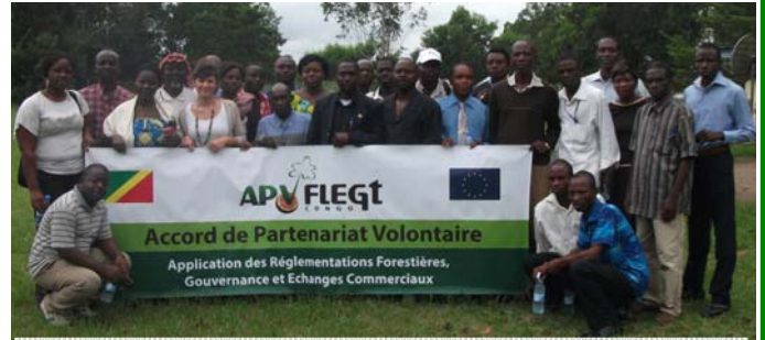
Les membres de la Plateforme pour la gestion durable des forêts

Elle a été mise en place en 2008, en vue de faciliter une meilleure implication de la société civile congolaise dans le cadre de l'Accord de partenariat volontaire sur l'Application des réglementations forestières, gouvernance et échanges commerciaux (APV-FLEGT) en République du Congo.