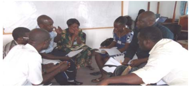
Les membres de la plateforme en séance de travail lors de l'atelier national qui a eu lieu du 20 au 22 février 2013