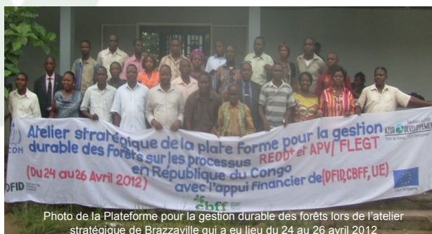
Photo de la Plateforme pour la gestion durable des forêts lors de l'atelier stratégique de Brazzaville qui a eu lieu du 24 au 26 avril 2012

Elle a contribué à la négociation de l'Accord de partenariat volontaire APV-FLEGT Congo. De même pour la REDD dont la version finale du Plan de Préparation du Projet a été validée en fin 2011.